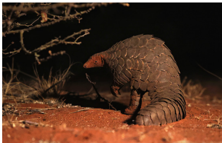
Kamera: EOS-1D X Mark III Objektiv: EF 70-200mm F2.8L IS III USM | Belichtung: 1/200 Sek., f/4, ISO 12.800