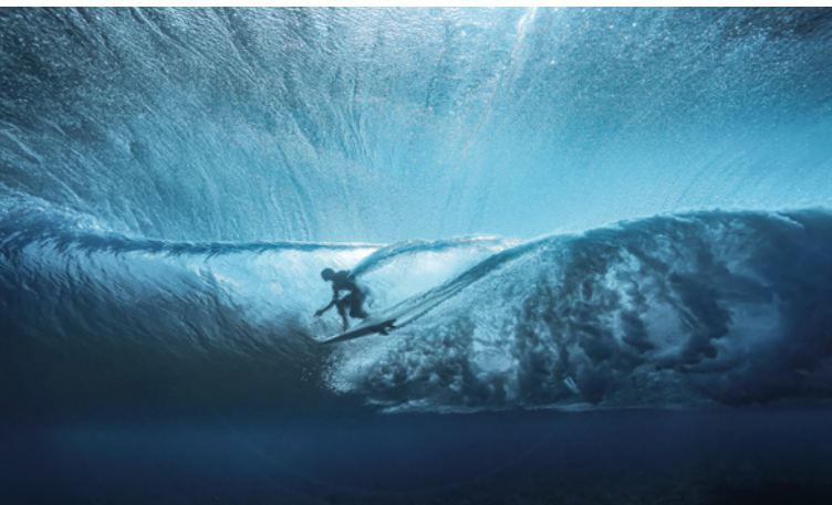
Kamera: EOS-1D X Mark III Objektiv: EF 8-15mm F4L Fisheye USM | Belichtung: 1/2.000 Sek., f/6,3, ISO 200

Für knackig-scharfe Bilder: Die Deep-Learning-Algorithmen des AF-Systems erkennen unterschiedlichste Situationen und verfolgen sogar Gesichter, die hinter Brillenglas oder von einem Helmvisier verdeckt sind.